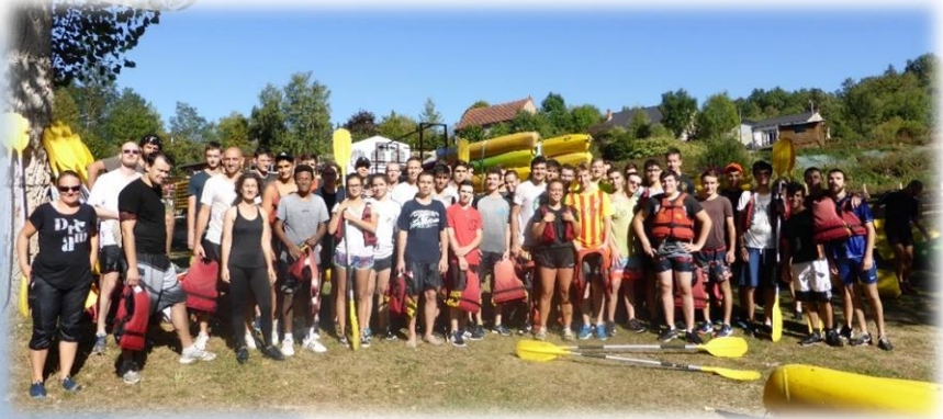
La promotion 2019/20 en sortie d'intégration canoë !